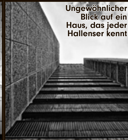
Ungewöhnlicher Blick auf ein Haus, das jeder Hallenser kennt