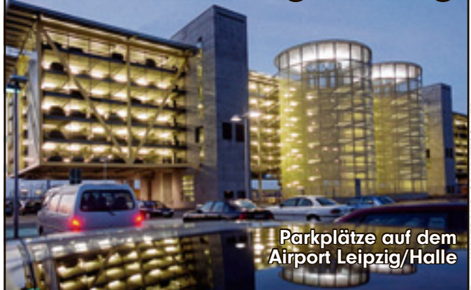
Parkplätze auf dem Airport Leipzig/Halle

Schkeuditz – Das Parken am Flughafen Leipzig/Halle ist im Deutschlandvergleich besonders günstig. Das teuerste Wochen-Ticket kostet hier 90 Euro, das billigste 20 Euro. Zum Vergleich: In München werden 250 Euro, in Frankfurt/Main 115 Euro für den teuersten Stellplatz pro Woche fällig. Das günstigste Tagesticket kostet am Schkeuditzer Airport 10 Euro, in Dresden 17 und in Berlin-Tegel sogar 26 Euro. Das Online-Portal „travel24.com“ hatte die Parkplatzgebühren von 17 deutschen und elf internationalen Flughäfen untersucht. Ergebnis: Die deutschen Airports haben die teuersten Parkplätze der Welt. Selbst in New York zahlt man mit maximal 96 Euro/Woche deutlich weniger als in München, Stuttgart oder Düsseldorf.