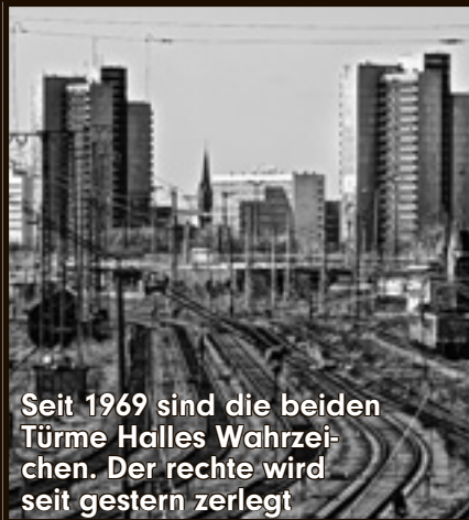
Seit 1969 sind die beiden Türme Halles Wahrzeichen. Der rechte wird seit gestern zerlegt