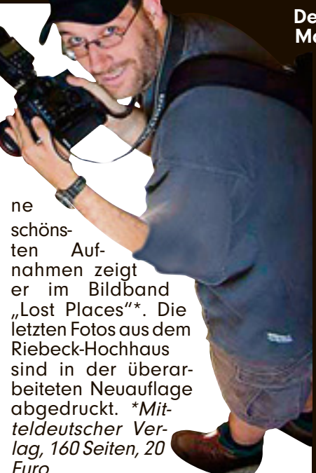
Der Fotograf Marc Mielzarjewicz

wicz strich, waren seit zehn Jahren verlassen. Zurückgeblieben sind nur Herde, Spülen, Durchreichen... „Die Wohnungen unterschieden sich lediglich durch das Muster der Tapeten. Die Grundrisse glichen einander“, sagt Mielzarjewicz. „Ich hatte das Gefühl, im gesamten Haus gab es nur zwei Varianten.“ Marc Mielzarjewicz durchforscht mit seiner Canon EOS 1D seit Jahren verlassene Gebäude – bisher bevorzugt er leer stehende Fabriken. Sei-