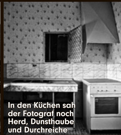
In den Küchen sah der Fotograf noch Herd, Dunsthaube und Durchreiche