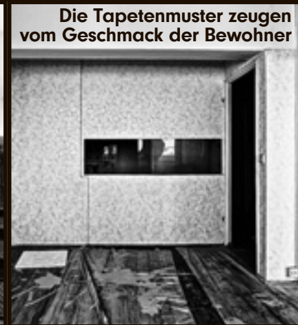
Die Tapetenmuster zeugen vom Geschmack der Bewohner