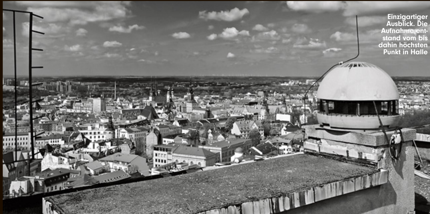
Einzigartiger Ausblick. Die Aufnahme entstand vom bis dahin höchsten Punkt in Halle